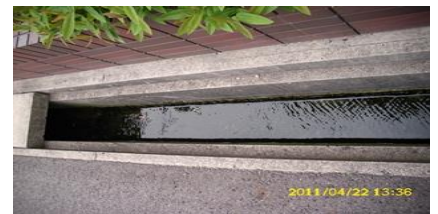
未処理の生活排水が直接放流される側溝