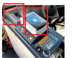
運賃箱(左)と、カード読み取り機(右)