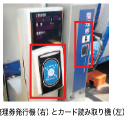
整理券発行機(右)とカード読み取り機(左)