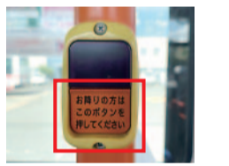
バスの各所に設置されている降車ボタン