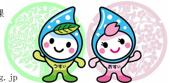
公共下水道事業マスコット キャラクター うすい&おすい