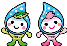
公共下水道事業マスコットキャラクター うすい&おすい