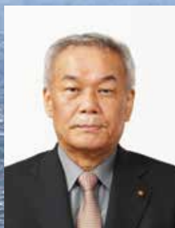
春日井市議会議長 友松 孝雄

結びに、1日も早い新型コロナウイルス感 染症の終息と、新しい年が皆さまにとって、 光り輝く素晴らしい年になりますよう心から お祈り申し上げます、年頭のあいさつとさ せていただきます。