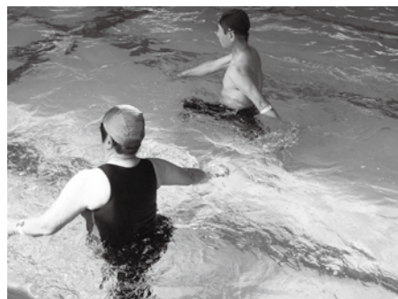
水中ウォーキング教室