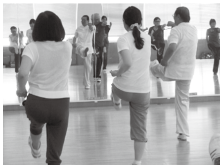
太極拳(初心者向け)