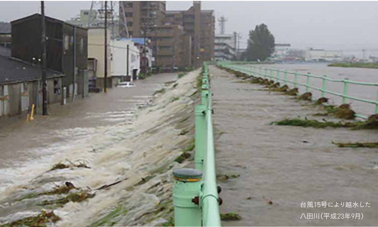
台風15号により越水した八田川(平成23年9月)

いつ、どこで発生するか分からない南海トラフ地震などの巨大地震やゲリラ豪雨などの自然災害。災害から自分自身や大切な人の命を守り、被害を最小限に抑えるためには、防災意識を持って、今からできることに取り組み、日頃から災害に備えておくことが重要です。また、今年は例年とは異なり、新型コロナウイルス感染症を踏まえた、避難対策などの備えも必要となります。 今回の特集では、自然災害への備えとして、これからできることを考えます。