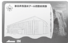
【今までの回数利用券】

券売機のリニューアルに伴い、今まで利用していたプリペイドカードの移行手続きを行っています。土・日曜日、祝日や夏休み期間は、混雑が予想されますので、理解と協力をお願いします。