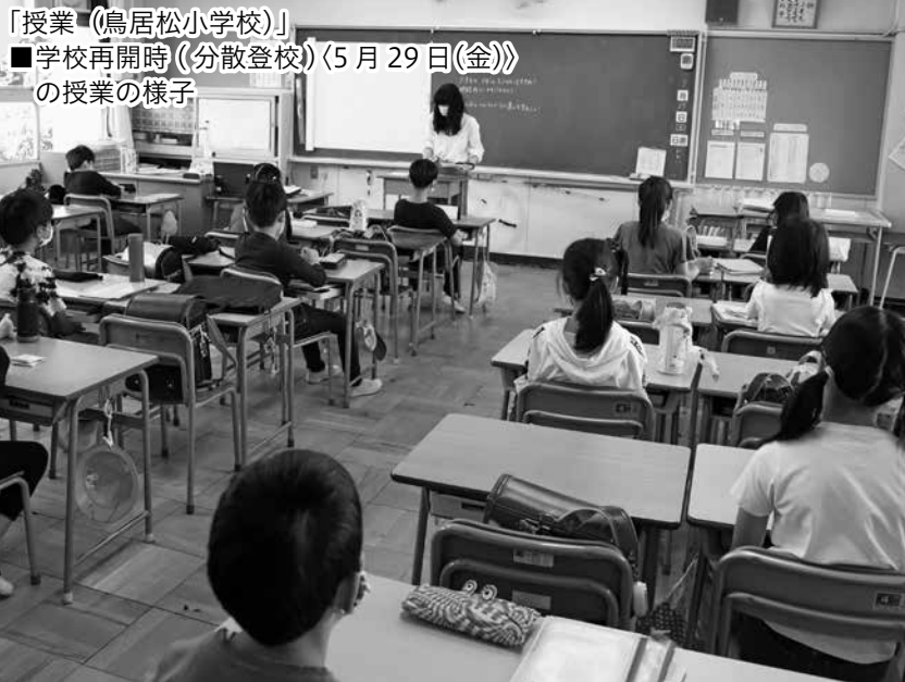
「授業(鳥居松小学校)」 ■学校再開時(分散登校)〈5月29日(金)〉 の授業の様子

6月8日(月)より全面再開した学校では、児童生徒などへの感染症対策に係る指導を行うとともに、学校での集団感染を防ぐためにさまざまな対策を行っています。安全・安心な学校生活を送るための、学校の新しい生活様式を紹介します。