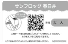
【新しい回数利用券(イメージ)】