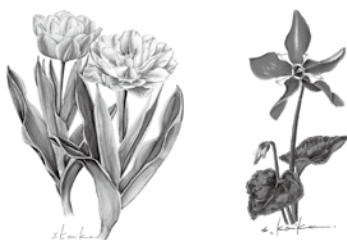
「ボタニカルアート(植物画)教室」

申 ①④は2月20日(木)、②③は2月21日(金)から電話で、⑤⑥は2月29日(土)〈必着〉までに、往復はがき(1人1枚)に 上の申込共通項目 を書いて、〒487-0001細野町3249-1へ ※⑤⑥はグリーンピア春日井ホームページでも申し込み可