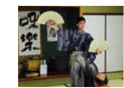
【日本舞踊家】 踊・odori[kanyou 家]

応募要件 ：市内に会場を用意できる団体 ※申し込み多数の場合は抽選。詳しくは、チラシ(市の主な公共施設に用意)か市ホームページ、かすがい市民文化財団ホームページをご覧ください。