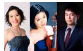
【ソプラノ、バイオリン、ピアノ】 ASTER