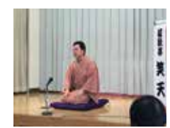
【社会人落語】 楽語の会