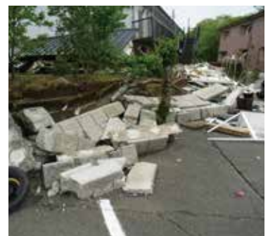
提供:(一財)消防防災科学センター