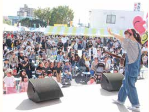
春日井まつりでのライブの様子

昨年は「チャレンジ」を目標に、保育士向けの研修や講演会を行いました。その中で自身の経験や保育のネタを伝えられましたし、先生たちの声を身近に感じることができました。今年の目標は「春日井から全国へ!」。もっと活動の幅を広げ、全国の子どもたちやママ、先生たちと出会い、「子育てに笑顔を」届けていきたいです。