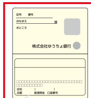
(イラストはイメージです。)