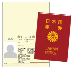
(イラストはイメージです。)