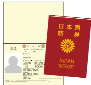
(イラストはイメージです。)