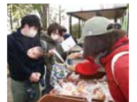
フードパントリー