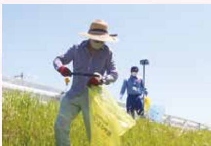
庄内川をきれいにする日