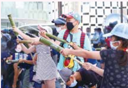
エコライフセミナー