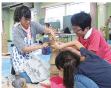
ハニワ制作大会の様子

二子山公園で10月22日(土)に開催する「ハニワまつり」で焼き上げるハニワを作ります。完成したハニワは、ふれあい緑道か二子山公園に並べます。