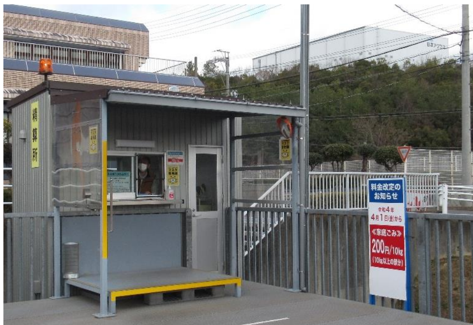
写真1 手数料改定の案内看板