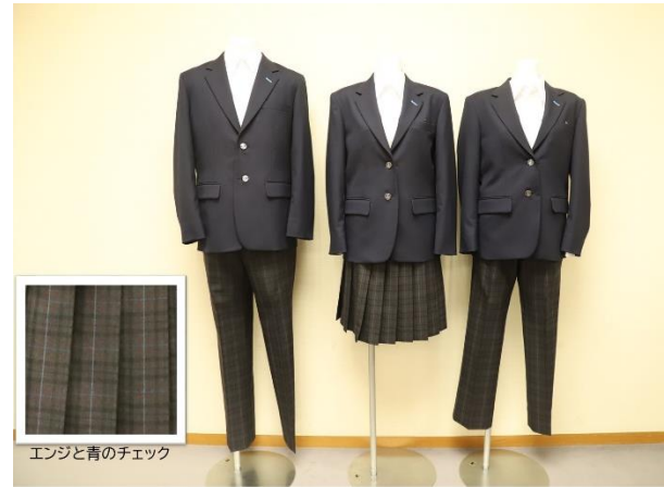
新しい制服デザイン候補 案D