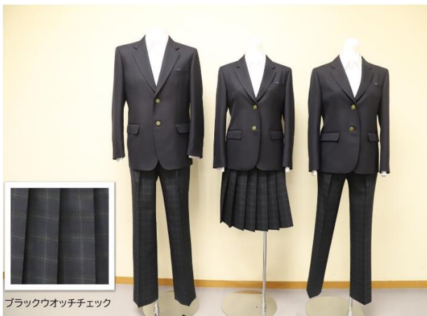
新しい制服デザイン候補 案E