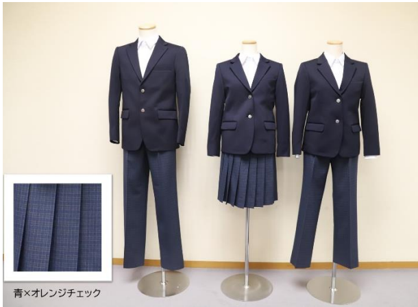
新しい制服デザイン候補 案C