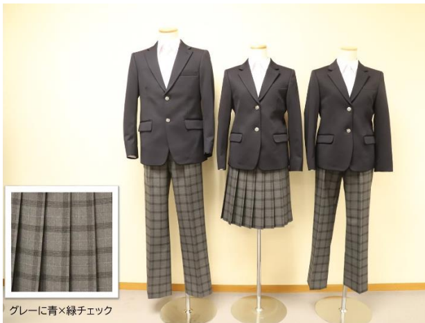
グレーに青×緑チェック