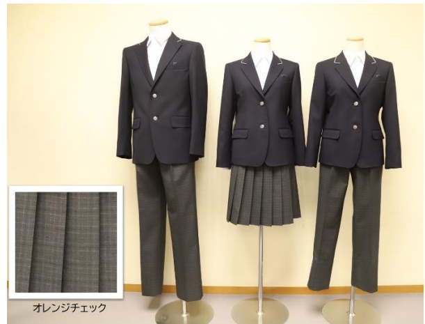
オレンジチェック