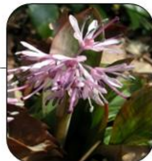
ショウジョウバカマ