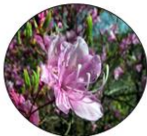
コハナミツバツツジ