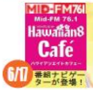
6/17 番組ナビゲーターが登場!