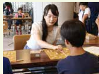
室田女流棋士と小学生5人の対局