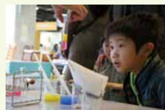
おもしろ実験コーナー

気象実験、道風くんと記念撮影会、バンド演奏、クイズラリー、ワークショップ(おもちゃの病院、エコ先3人の会、市婦人会協議会、悠遊会)、おもしろ実験コーナー、調理パン出張販売、工場見学会、エコカーの展示、ダンボール箱の迷路、スロットカーレース など