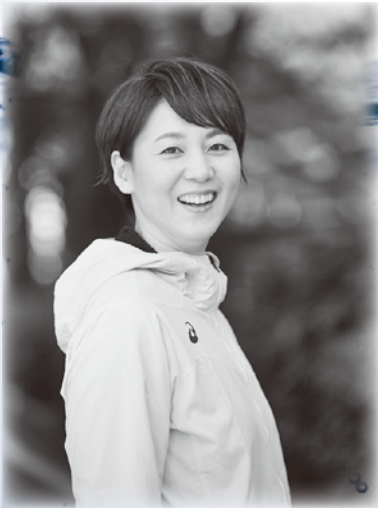
春日井広報大使 萩原智子

水ケーションは「水」を通して「Communication(通じ合う)」・「Education(教育)」の2つの意味を込めた造語です。水ケーションで、水や森の大切さを学びませんか。