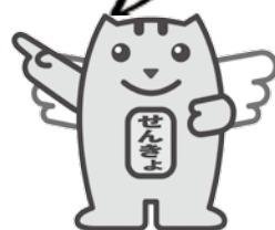
選挙のめいすいくん