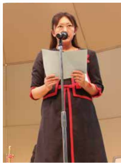
文化・スポーツ都市宣言記念式典で宣言文を朗読しました。

世界70か国をレースで転戦してきましたが、文化とスポーツが成熟しているということは、治安が良く豊かで住みやすいまちの証でした。今回の文化・スポーツ都市宣言により、春日井が、さらに生きがいを感じられるまちに発展していけばと思います。