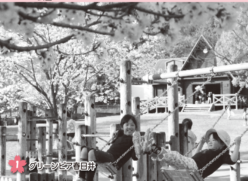
1 グリーンピア春日井