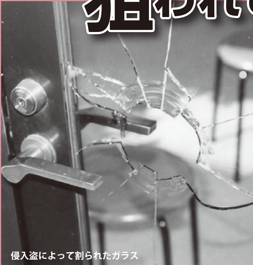
侵入盗によって割られたガラス