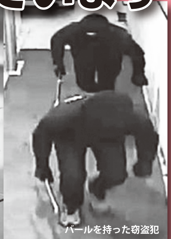
ボールを持った窃盗犯