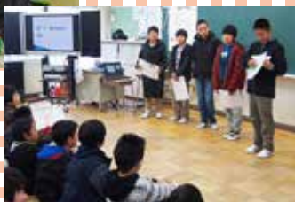
学習発表会での英語発表の様子