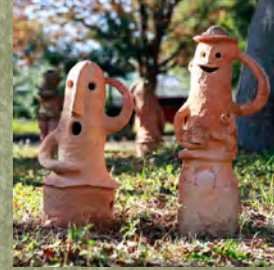
いろんな動物たちに