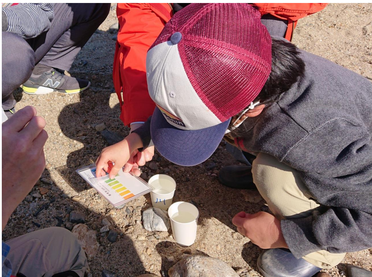
水質調査「庄内川ってきれいなの？」(R2.11.14)