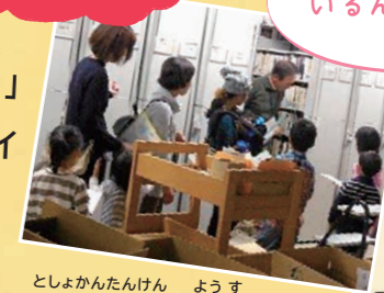
図書館探検の様子