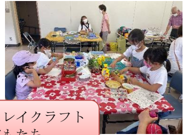
マグネット飾りやクレイクラフトづくりを楽しむ子どもたち