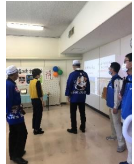
兵馬俑写真展示の説明を聞く市長