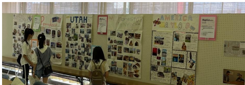
海外留学での生活体験の報告やホームステイ交流写真展示