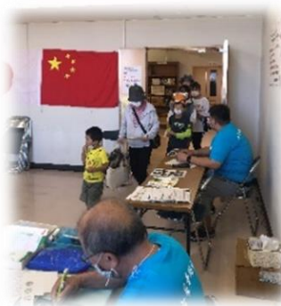
中国結びの体験と切紙の体験