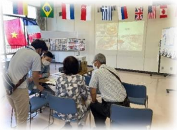
日本語教室学習者によるベトナムの紹介