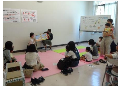
姉妹都市ケローナの紹介と絵本の読み聞かせ