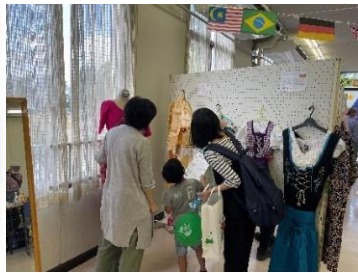
民族衣装のクイズに挑戦