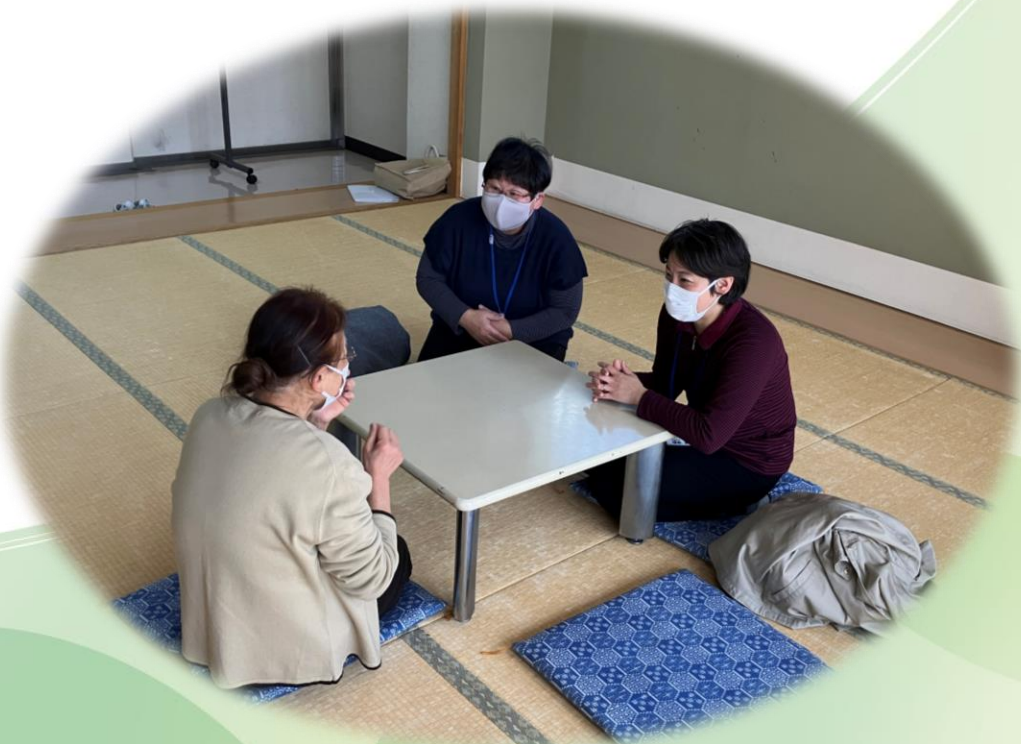
傾聴ボランティア活動（イメージ）