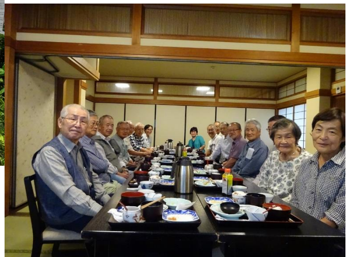
わの会の ミニ講演後はランチ