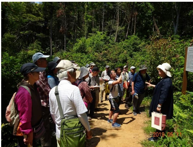
小牧山城、上街道小牧宿を 散策