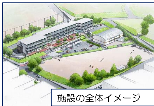
施設の全体イメージ

この施設から、賑わい創出や居住促進など、高蔵寺ニュータウンの魅力をさらに高めます！