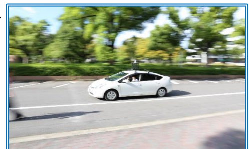
自動走行車イメージ

市は、県が行うこの擬似体験のモニターの募集 や、ヒアリング方式のアンケート調査(属性、無人 タクシーの利便性、安全性、活用方法等)に協力 します！