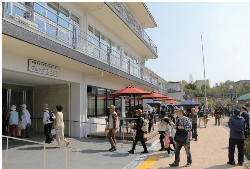
写真7 グルッポふじとう

また、センター地区や隣接する中学校、高校と一体となった「まなびと交流のセンター」としては、烏洞公園への保育園移転整備は別地建替えにより実現しなかったが、グルッポふじとう周辺の歩道拡幅等による交通環境の改善を行った。