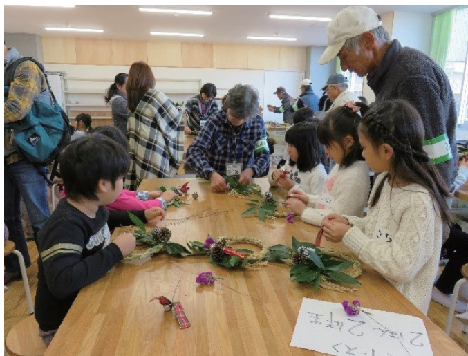
写真 13 藤山台中学校区学校地域連携協議会事業の様子(2016年度)

また、市内の地域包括支援センターの再編に伴い、住み慣れた地域で高齢者を支える地域包括ケアシステムを確立した。