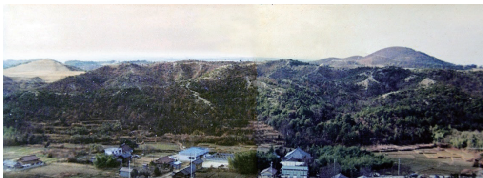
○外之原町から高蔵寺ニュータウン方面を撮影 (1971年頃)