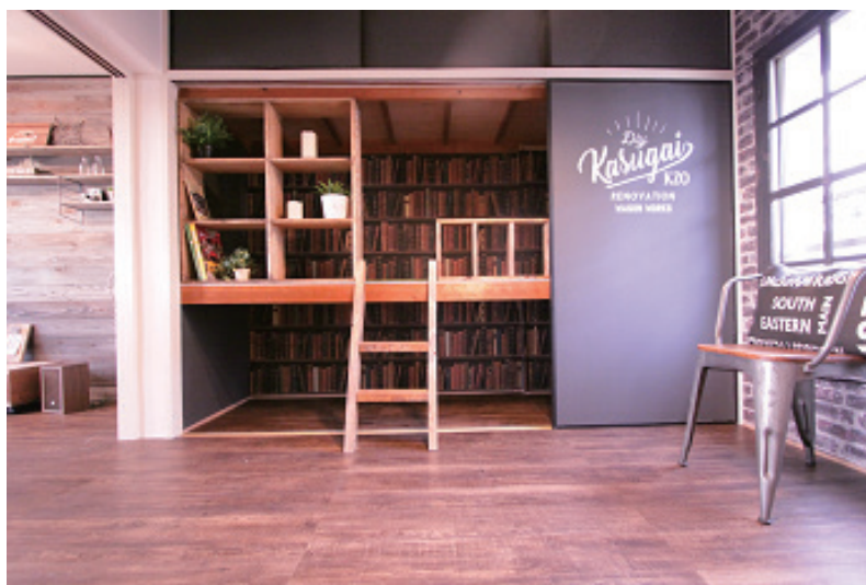
写真12 DIYリノベーション住宅(2017年度)