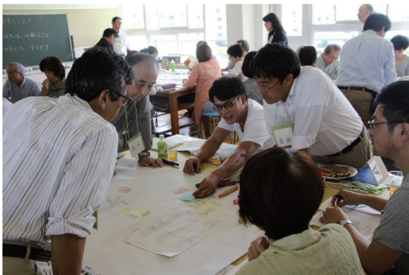
写真4 旧小学校施設の整備に向けたワークショップの様子