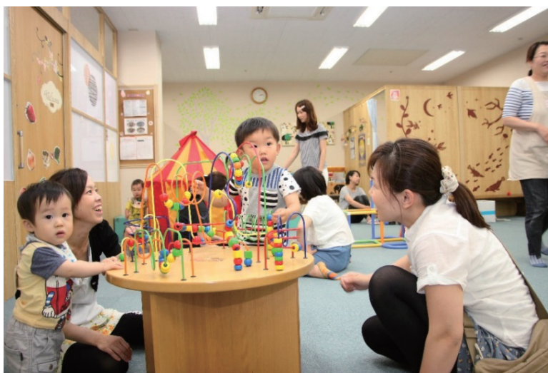
写真3 東部子育てセンター

高蔵寺ニュータウンの総合的なまちづくりに向けて、本格的な取組が始まった契機は、2013年(平成25年)の藤山台地区における小学校統合である。2013年以降、高蔵寺ニュータウンを専門に担当する市政アドバイザーの設置、まち語りサロンの開催、市と都市再生機構中部支社のまちづくり支援のための覚書の締結、公民連携による空き家流通促進のためのプロジェクト、住民参加型の*インフラ修繕活動「緑のクリーンプロジェクト」等の施策を集中的に展開してきた。2016年(平成28年)には新たな藤山台小学校が地域に開かれた学校として開校し、高蔵寺ニュータウンの総合的なまちづくりの計画として、「高蔵寺リ・ニュータウン計画」を策定した。