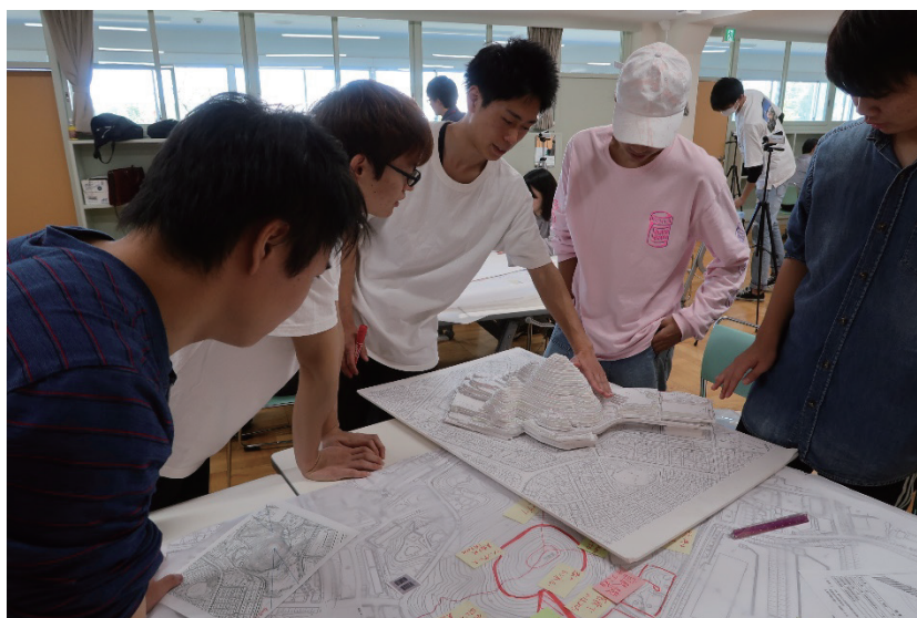
写真 11 高森山公園の利活用検討のためのワークショップの様子(2019年度)

これらの基礎資料に基づき、高森台地区におけるスマートウェルネスモデルのあり方の検討を進めている。