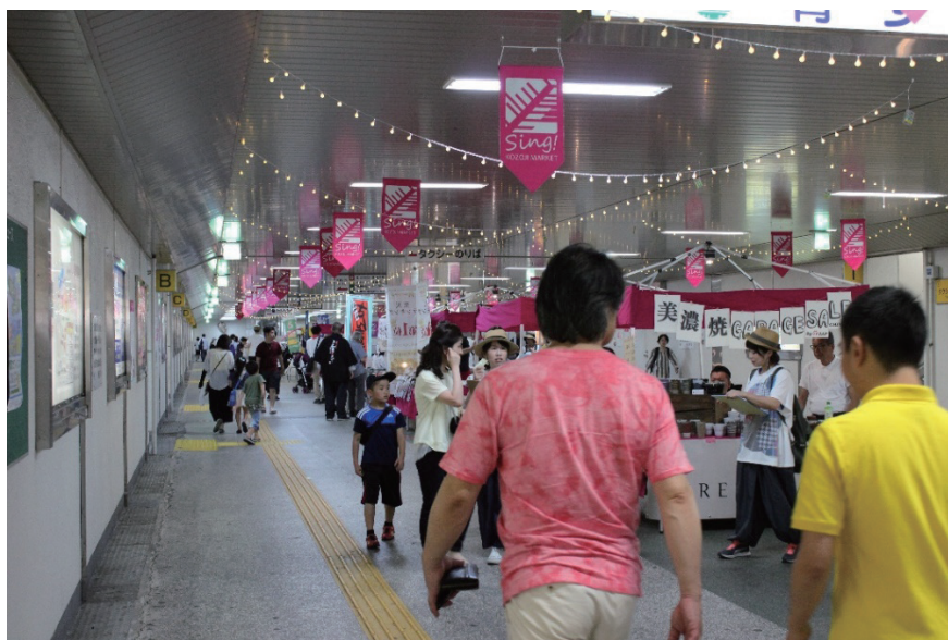
写真8 賑わい実証事業「歌う！高蔵寺マーケット」の様子(2019年度)

地下道では、賑わい実証事業「歌う！高蔵寺マーケット」を継続的に開催し、新たな商業事業者の発掘、集客を行うことによる賑わい創出などを行っており、南口駅前広場とともにデザイン検討及び実施設計を行っている。