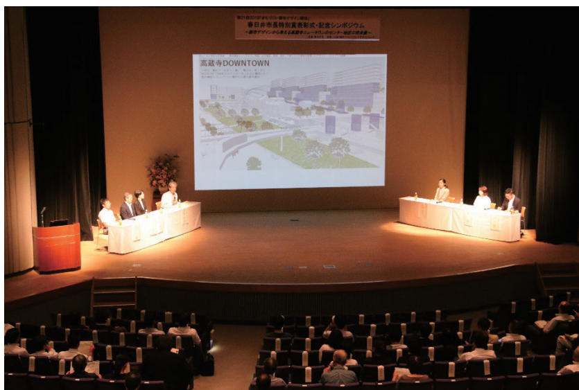
写真10 第21回2018「まちづくり・都市デザイン競技」春日井市長特別賞表彰式・記念シンポジウムの様子(2019年度)

交通結節機能を高めるためのバスターミナルや交通プラットフォーム、回遊性を高めるランジットモール等の整備については、具体的な検討の着手には至っていない。