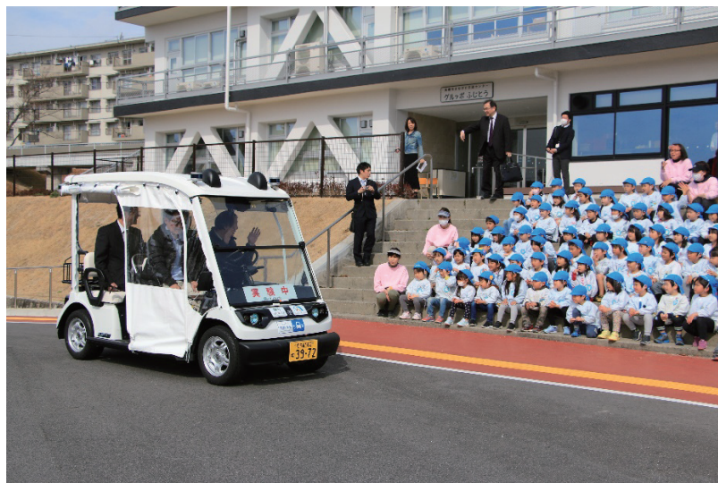
写真9 ラストマイル型自動運転移動サービス実証実験の様子(2018年度)

高蔵寺ニュータウン全体の交通ネットワークの構築にあたっては、具体的な検討の着手には至っていない。