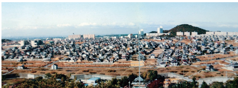
○上段写真とほぼ同じ場所から高蔵寺ニュータウン方面を撮影 (1986年頃)