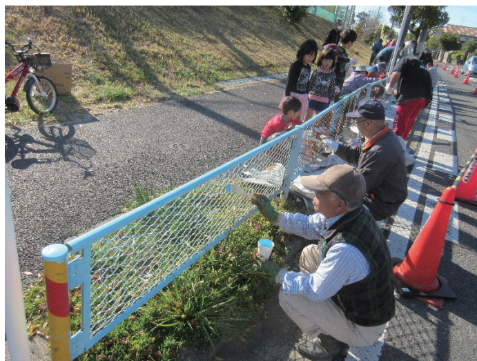
写真 14 藤山台小学校前のガードレールのペンキ塗りの様子(2016 年度)