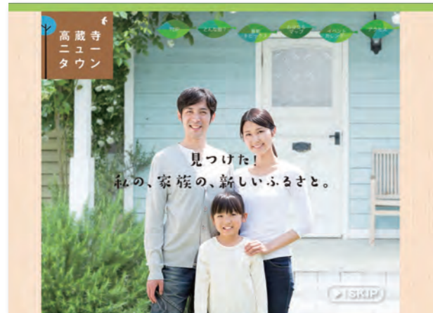
高蔵寺ニュータウン公式サイト http://kozoji-nt.com/

高蔵寺ニュータウンの魅力情報を発信しています。ニュータウンの歴史や現在のコミュニティ活動などを紹介するとともに様々なイベント情報なども発信しています。