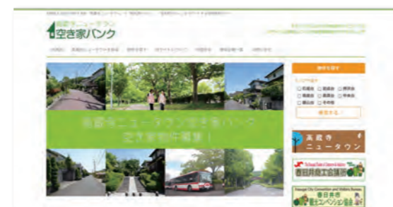
空き家バンクホームページ http://k-akiyabank.com/