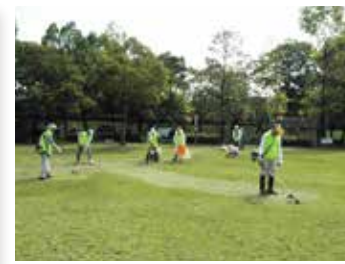
広大な石尾公園を地元の有志が集まり、ボランティアで定期的に清掃、除草活動をしています。ベンチの塗装も行いました。公園のさまざまな有効活用についても考えたいと、意欲的に取り組んでいます。(石尾公園・石尾台)

ている話もよく聞きます。しかし残念なことに、高齢化などの理由で地元でできなくなっている公園も少なくありません。みんなの公園です。みんなで守りたいものです。