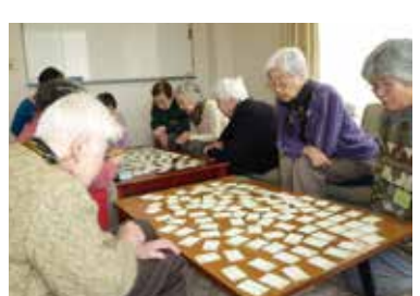
「天の原 ふりさけ見れば…」 「は〜い」百人一首を楽しむ人たち。(ふじの会・藤山台)

各地域の地区社会福祉協議会では親しみのある名称を付け、花見や新年会などの行事で親交を深めたり、地区によっては子どもたちとの交流を楽しんでいるところもあります。 石尾台「おしゃべりサロン」 岩成台「フレッシュクラブ岩成」 岩成台西「ほのぼの」 押沢台「ひだまりサロン」 高森台「はつか会」 東高森台「ほっとサロン」 中央台「中央台ふれあいサロン」 藤山台「ふじの会」