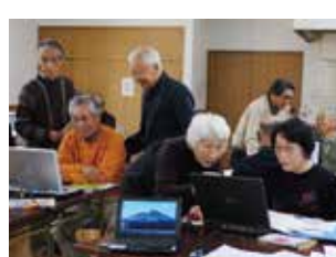
「PC倶楽部」は、同会の分科会としてパソコンに興味のある仲間が集まり、上級者が初心者に手ほどきしながら、互いに学び、レベルの向上を目指します。(いちじくの会・高森台)

メンバーは高森台一、二、三丁目の方皆さん。ゴルフや麻雀、囲碁などを仲間とたしなみ、パソコンや写真撮影の技術を学ぶなど向学心もいっぱい。サークルのように会員たちが主体的に取り組み、ホームページを立ち上げるほど活発に活動しています。 学習後の「お茶タイム」もメンバーの楽しみの一つ。談笑しながらさらに親睦を深めています。