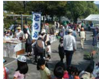
地区社協とコミュニティの共催で行われる秋のフェスティバル。フリーマーケットや豚汁の無料配布、焼き鳥屋などもあるにぎやかな一日。(押沢公園・押沢台)

公園は地域の人にとって、最も身近な公共の場所です。それぞれの地域で祭りや、花見会などのイベントが催され、お年寄りも子どもたちも一緒になって楽しい時間を共有しています。