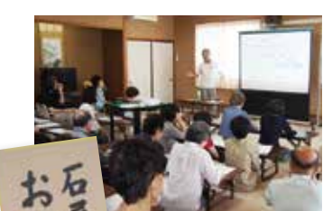
毎月の授業を楽しみに、どん欲に学ぶシニアたち。(おとなの学校・石尾台)

国語、算数、理科、社会、体育に音楽：楽しそうに学ぶ石尾台地区のシニアたち。講師は現役をリタイヤした多彩なキャリアを持つ地元の人たちがボランティアで務めています。川柳やクラシック音楽、各種業界の仕組みなど、毎回趣向を凝らした授業があり、大人ならではの知的好奇心をくすぐる内容。知識を深め、欲張りなほどに学んでいます。「いつでも新たな発見があり楽しめますよ」と参加者に好評です。