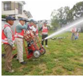
月に1回集まって、備蓄された飲料水の入替えや器具の点検。備えあれば憂い無し。放水よし(向工田公園・押沢台)

公園は地域の中で最も身近な防災活動の拠点です。防災器具庫が設置されていたり、各地域では定期的に防災訓練を行っています。まちの祭りに、非常時の炊き出し訓練を兼ねて、大鍋料理やおにぎりを作っている所もあります。石尾公園、岩成公園、後田公園、押沢公園、藤山公園は緊急避難所として指定されています。