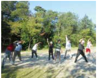
一人で始めた早朝のラジオ体操。いつの間にか仲間も増えて、ラジオに合わせて「1・2・3」(押沢公園・押沢台)

公園は青空の下、のびのびと誰でも運動ができる場所です。各公園ではダンスや太極拳、グラ