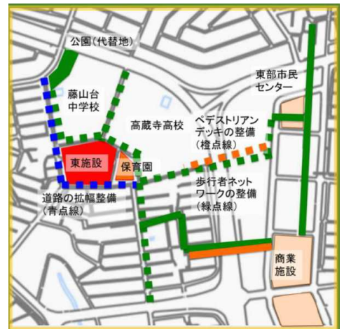
※ 藤山台中学校区旧小学校施設の活用のための基本方針