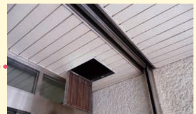
玄関横シャッター周り