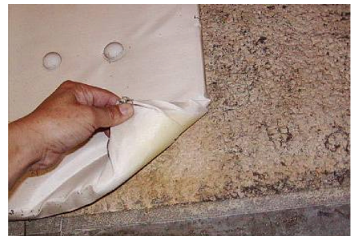
※写真はグラスウール貼りの裏にあった吹付け材です。

https://www.jesc.or.jp/training/tabid/132/Default.aspx