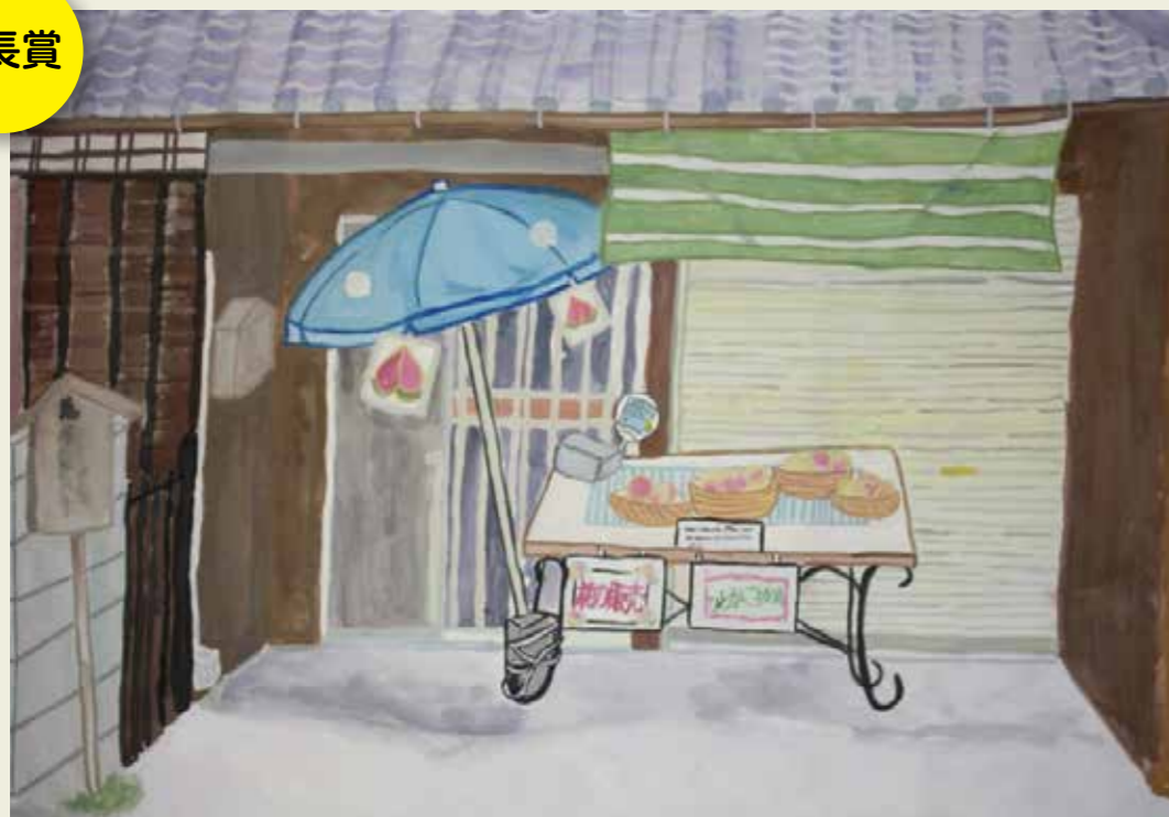
坂下小学校 6年 坂下町 伊藤さん宅 桃ぶどう直売店 「萬屋新兵衛跡」という立て札が立っていて、昔は旅籠屋でした。 今ここで売ってる桃やぶどうは毎年買いに来ています。どちらもおいしいです。