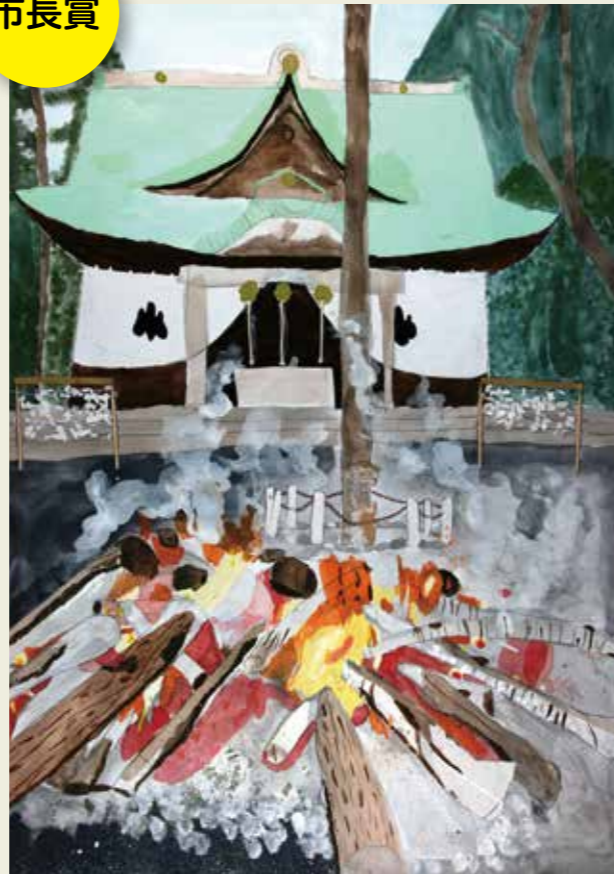
坂下中学校 3年 正月、内々神社のたき火 新年の温かい香り。