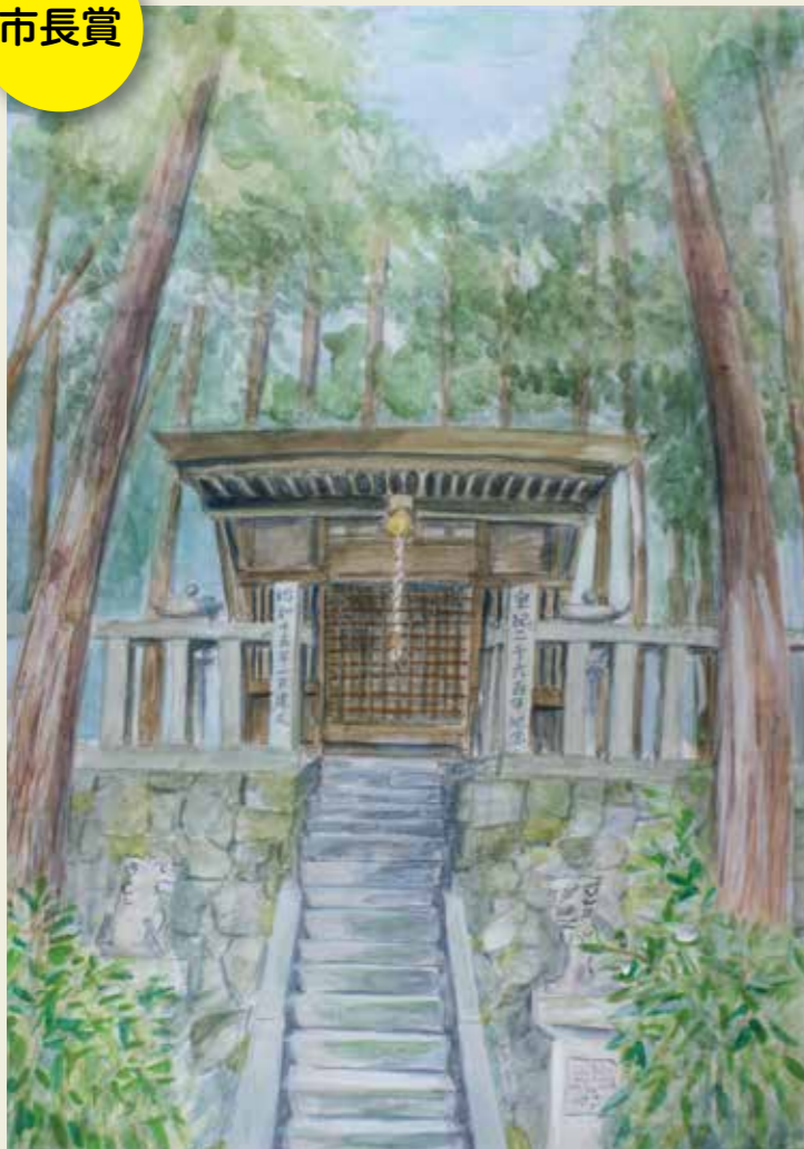
高森台中学校 3年 岩船神社 真夏日に涼しさと静けさを感じた