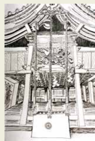
篠木小学校 5年 二子山古墳白山神社 心がおちつく音