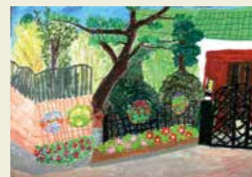
味美小学校 2年 グランマのにわ お花のかおり