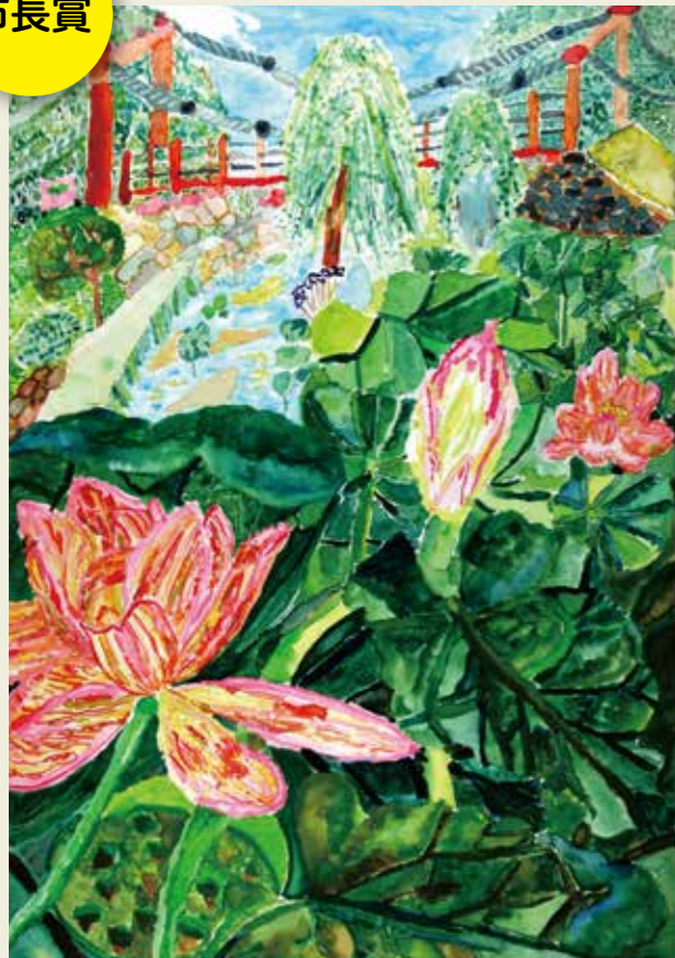
白山小学校 4年 春日井市東野町西の三ツ又ふれあい公園 ハスが生きしげる香り