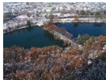
第4回 推薦「雪の新池公園」(高座台)