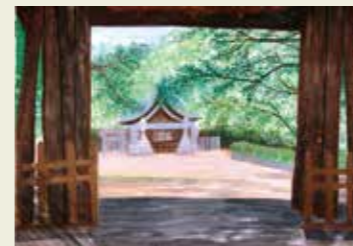
鷹来小学校 5年 伊多波刀神社 夏の香り