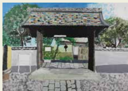
北城小学校 2年 退休寺から見た下街道の古井戸 ふるいどを見ておちつきました。