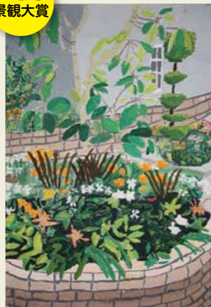
押沢台小学校 2年 グリーンピア かすがい いろんなみどり が あってきれい