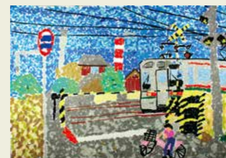
小野小学校 3年 王子ふみきり 電車が近づく音とふみきりの 音がかさなっている音