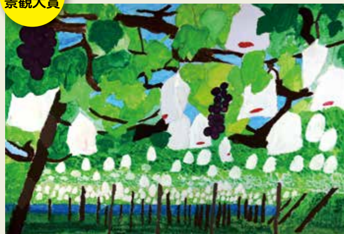
味美小学校 5年 桃山町近辺のぶどう園 ぶどうの香り