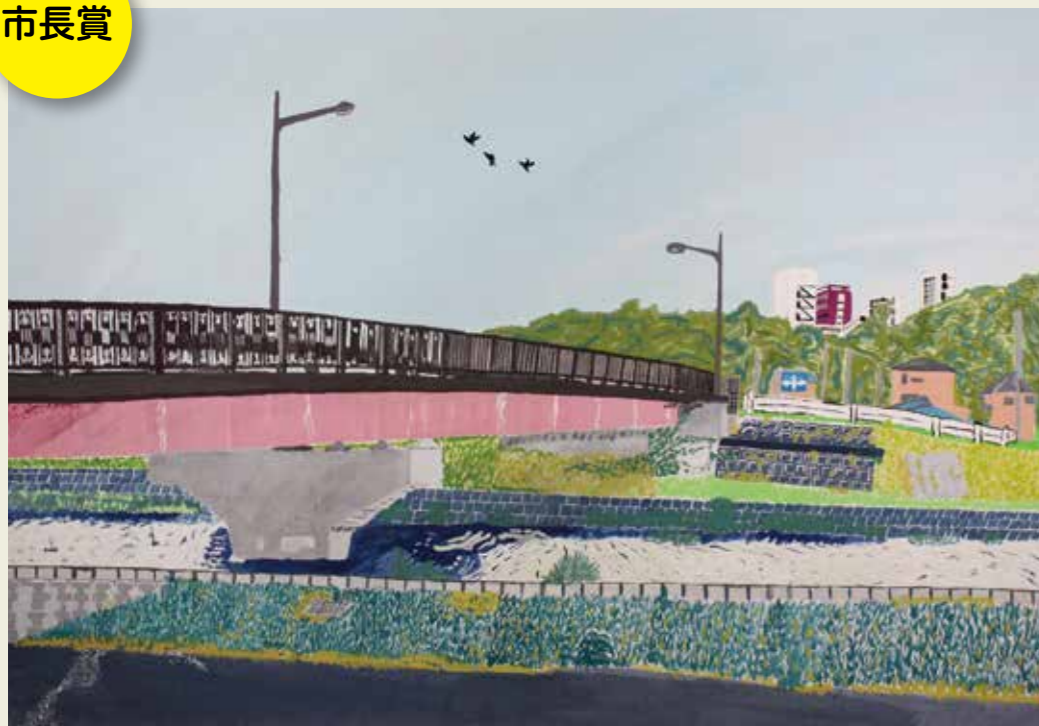
高蔵寺中学校 2年 内津川沿いから見た風景 川沿いから見える緑と空の 自然の大きさと迫力のある 立派な橋にひかれました