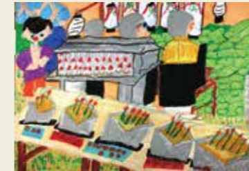
山王小学校 2年 勝川公園の南部学供前 おぼん（精霊送り）の香りがある風景