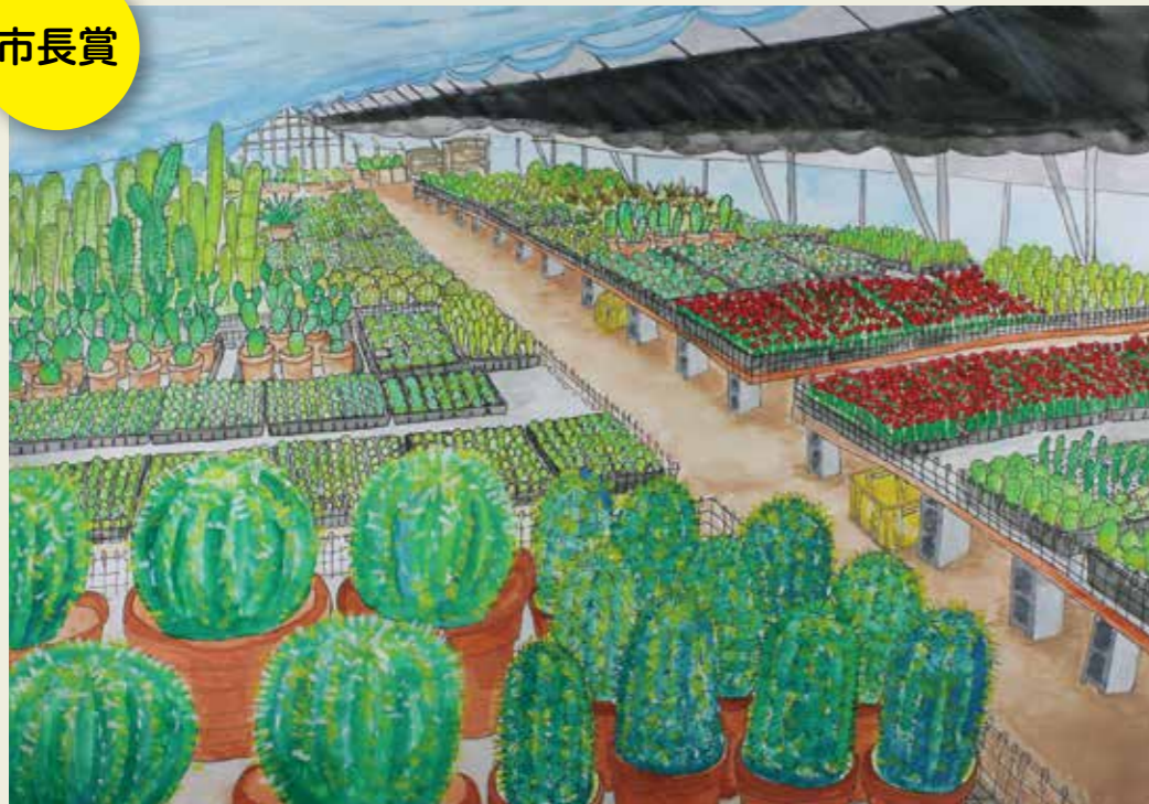
松原小学校 6年 サボテン園のサボテン 痛そうだった