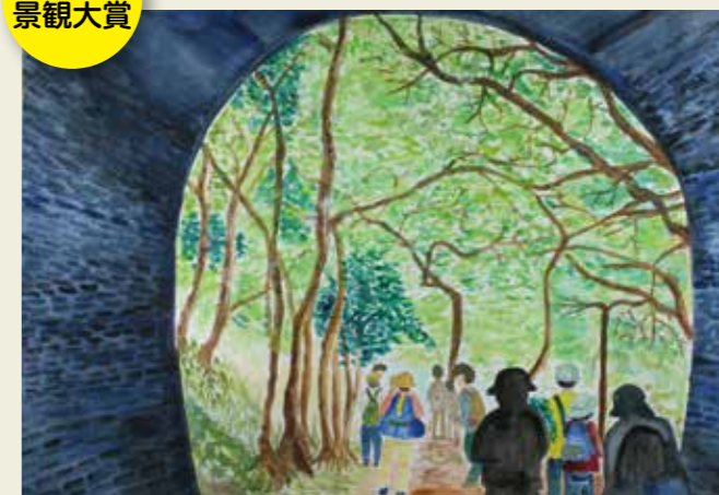
知多中学校 3年 愛岐トンネル 昔の人々の営みを感じた