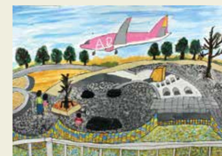
白山小学校 3年 エアフロントオアシス 飛行機のエンジン音