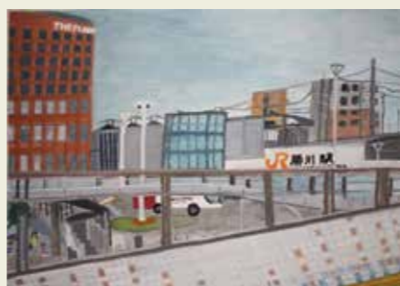
山王小学校 5年 勝川駅 人通りが途絶えて、 一人じめた気分になった。