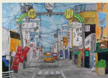
山王小学校 5年 春日井市旭町勝川駅前通 商店街では、看板、旗、のれんなど いろいろ工夫されていると感じました。