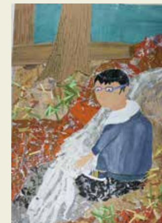
坂下中学校 2年 東海自然歩道のみろく山の川の水 とても冷たかった