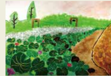
鳥居松小学校 3年 三ツ又ふれあい広場の池に広がるはず 夏のおとずれを感じる香り