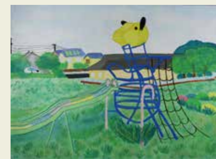
南城中学校 1年 カンガルー公園 公園で楽しかった思い出を感じた