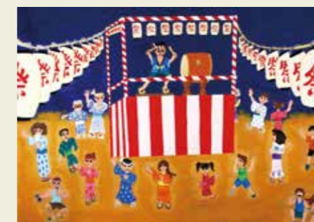
鷹来中学校 1年 夏祭り会場 「春日井よいとこ」が流れている風景