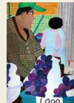
1,000 篠木小学校 4年 松浦農園 ぶどうの甘い香りがしました。