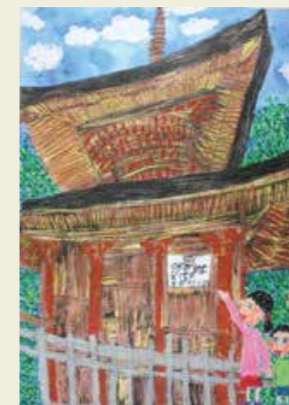
山王小学校 3年 密蔵院 多宝塔

去年ぼくは、はにわを作りました。2日間かかり、とても大変でした。でも今ふれあい緑道にかざってあるので、うれしいです。昔の人もこうやって大変な思いで、はにわを作っていたのだと思うと少しだけ歴史を感じることができた気がしました。