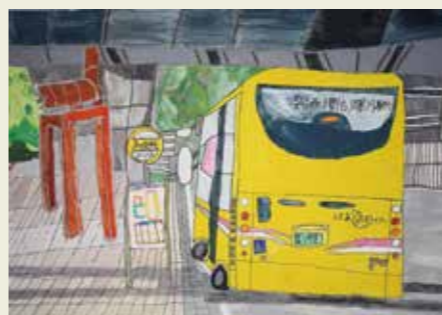
不二小学校 2年 春日井市役所バス停 黄色いバスは夏の色だと思いました。