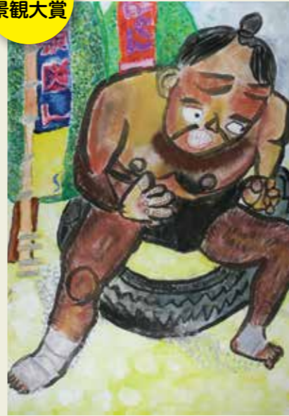
白山小学校 2年 大和通地藏寺内 玉ノ井部屋 すもうのけいこ 力強い大きな体の おすもうさん。 また、いつか会いたいな。