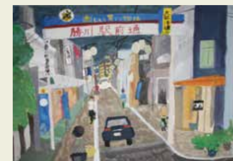
山王小学校 5年 勝川商店街 習い事の帰り、 夜の商店街が新鮮だった。