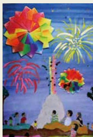
勝川小学校 2年 おちあいこうえん ヒューバババパーン!