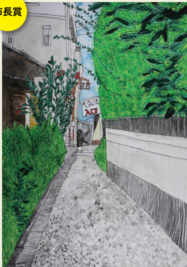
山王小学校 6年 春日井市八光町 勝川大弘法 路地に入って左の木 右の高い木との バランスがいいなあと感じました。