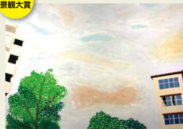
高森台中学校 2年 自分の家のベランダから見た風景 雲の流れていくような音を感じた