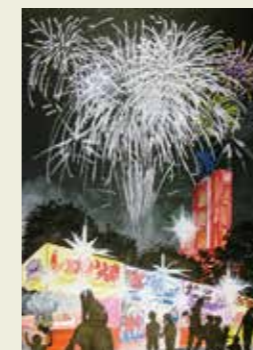
篠木小学校 6年 春日井市民納涼まつり ソースの香り