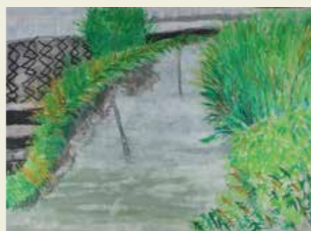
北城小学校 5年 公園の川 気持ちいい風を感じた