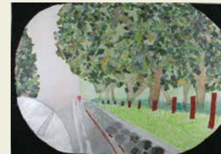
鳥居松小学校 4年 車からみたサイドミラーの中の 水道路 風にふれた

14世紀に出来たといわれる密蔵院多宝塔にふれることができました。春日井市にこんな立派な重要文化財があるのにびっくりしました。