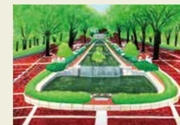
藤山台中学校 3年 植物園 夏限定の植物の香り