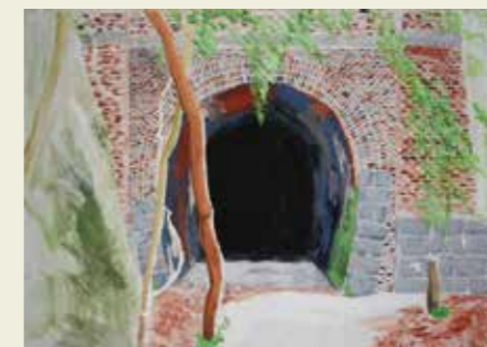
知多中学校 2年 愛岐トンネル 自然の中で歴史を味わった