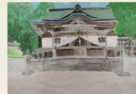
中央台小学校 4年 内々神社 ちょうこくをみて勢いを感じた。