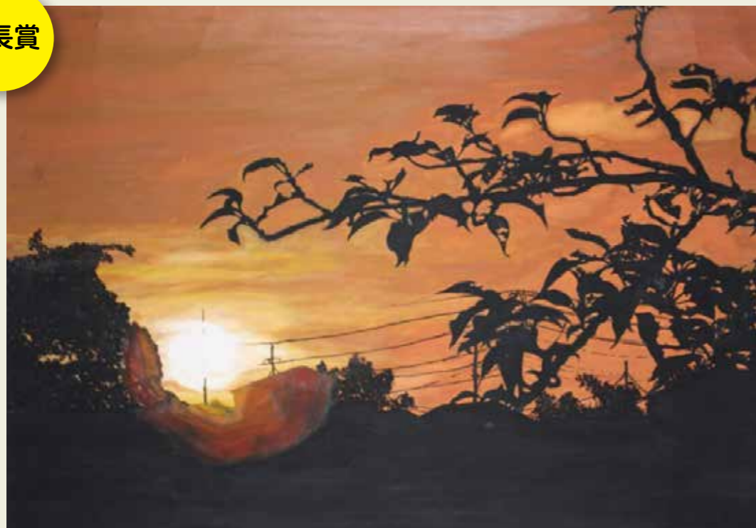
西部中学校 2年 家の前にある田んぼから見た夕日。 影と光がハッキリしていて、自分好みのキレイな夕日だな、 と感じつつ、ポーッ……とながめてました。