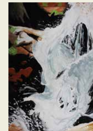
知多中学校 3年 愛岐トンネル道中の滝 自然の雄大さを感じた