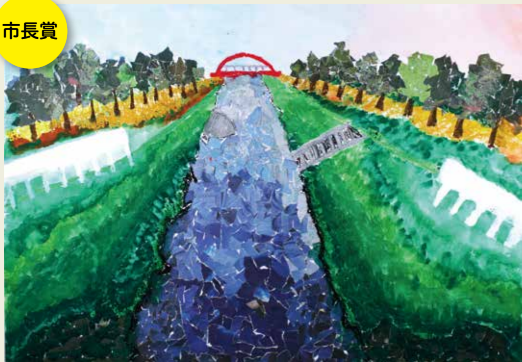
鳥居松小学校 2年 朝宮公えんの中の川 心がおちつく川の音