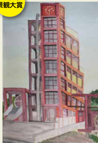
篠原小学校 6年 落合公園の時計台 夕日のあたたかさを感じた。