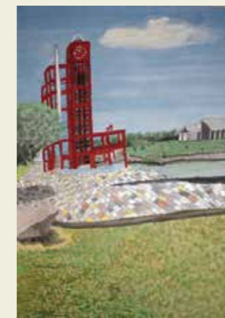
北城小学校 3年 落合公園の赤い塔 猛暑の中、水辺で癒しを味わった。