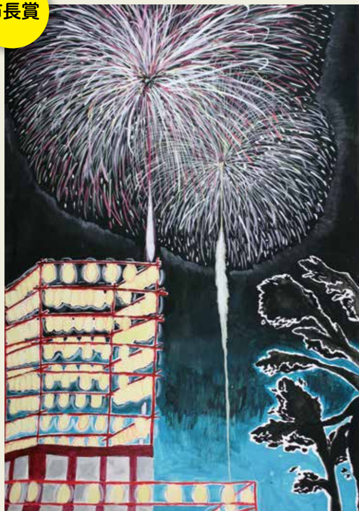
藤山台中学校 2年 落合公園の花火大会 「ドーン!」「パーン!」 「バチバチ」「ヒューン」など