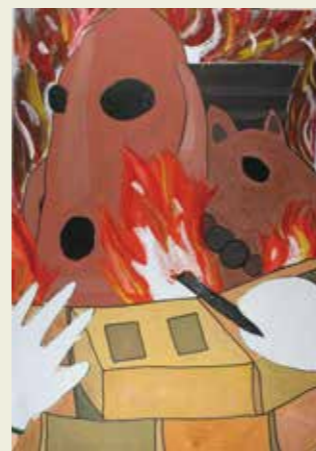
松原小学校 4年 はにわ作り

去年ぼくは、はにわを作りました。2日間かかり、とても大変でした。でも今ふれあい緑道にかざってあるので、うれしいです。昔の人もこうやって大変な思いで、はにわを作っていたのだと思うと少しだけ歴史を感じることができた気がしました。