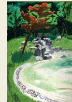
味美中学校2年 二子山公園 木々のみどりと水の香り