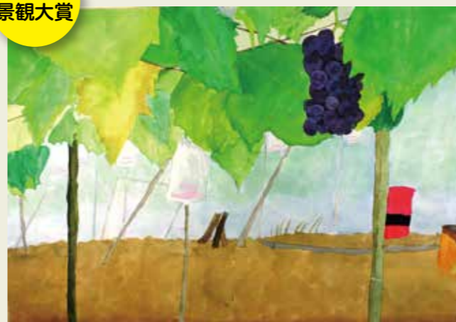
岩成台小学校 6年 大泉寺町のぶどう畑 ぶどうのあまいにおいと葉のゆれる音