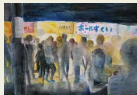
高森台中学校 3年 落合公園まつり 屋台の様子