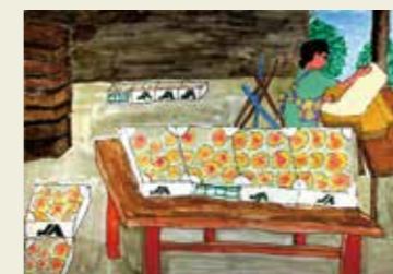
高座小学校 2年 もも山町のももちよくばいじょ もものいいにおい あまいかおり