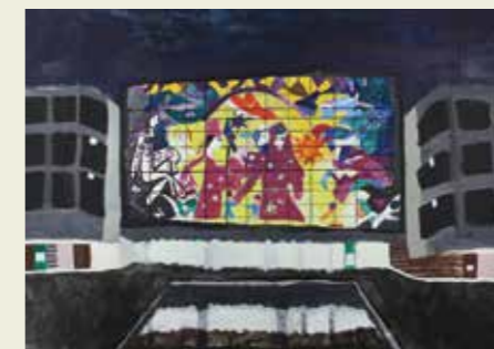
東野小学校 3年 夜にかがやく LIVIN のステンドグラス きれいだなとおもいました。