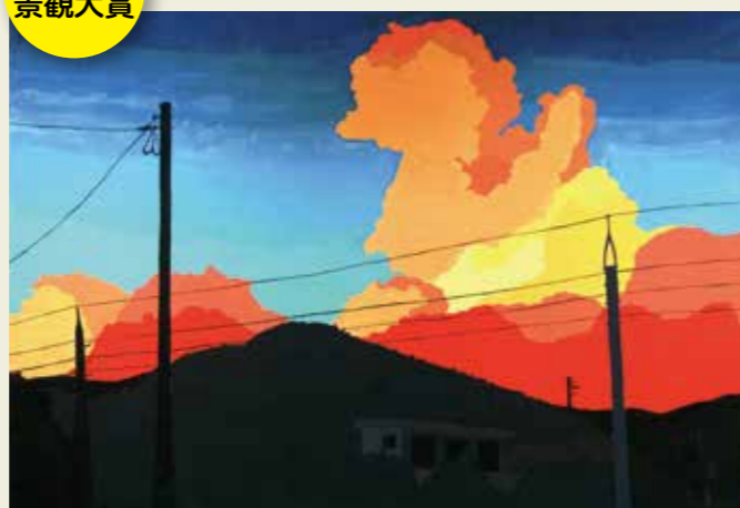
高森台中学校 3年 駐車場から 風に乗ってきた夕立ちの香り