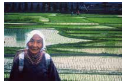
第3回 推薦「五月のおばあさん」(小木田町)