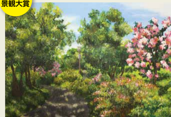
西部中学校 3年 木陰の散歩道 この日はとても暑くて、太陽の光がいつもより強く感じ ました。木の葉1枚1枚も輝いていて、真夏の迫力のす ばらしさと静かで心地良い木陰がとてもステキでした。