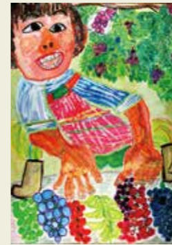
白山小学校 1年 春日井市桃山町にあるぶどう直売 尾関農園 さわやかな あまい香り