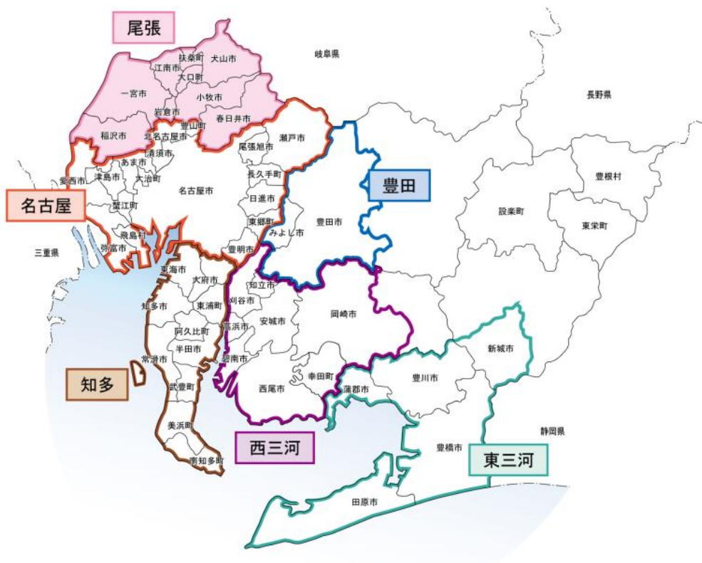
図：愛知県内の都市計画区域