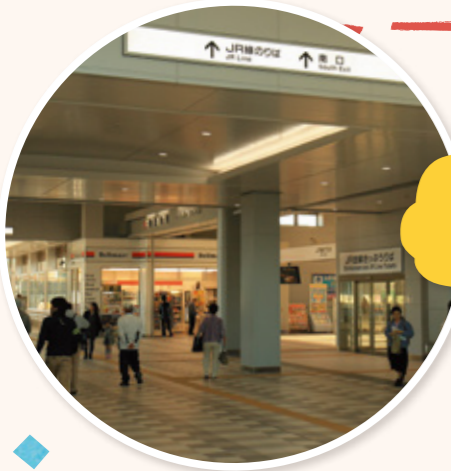
ほごうしゃせんようどうろ 歩行者専用道路

にちお 1日あたり、およそ3万人が利用するJR かが い え き 春日井駅。より使いやすい駅にするため に、平成24年度から工事を始めて、10 がつ にち にち う か 月30日(日)に生まれ変わりました。新 かが い え き しい春日井駅を紹介します。