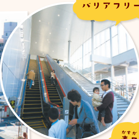
か バリアフリー化

こどもや高齢者、障がい を持った人など、全ての ひとにやさしい駅にするた め、エレベーターやエスカ レーター、多目的トイレな どを設置しました。