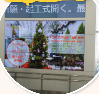
こうきょうけいじばんせっち 公共掲示板の設置

たて 2.8m、横 3.6mの大きな モニターです。上の画面では ニュースが流れ、下の画面で は春日井市からのいろいろ な情報などが表示されま す。また、台風や地震など災 害がおきたときは、緊急情 報も流れるようになります。