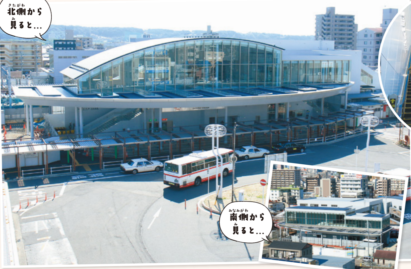
みなみがわ 南側から みると...