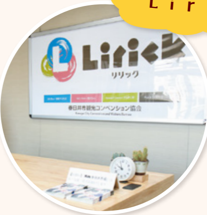
かが い じょうほうはっしん 春日井情報発信センター 「Lirickリリック」

しな い かんこう 市内の観光スポッ トやイベント・店な どの情報を案内す る施設です。