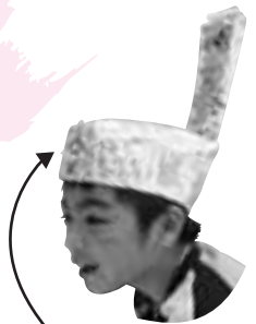
平安朝にちなんだものを作ります