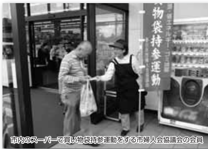
市内のスーパーで買い物袋持参運動をする市婦人会協議会の会員

わたしたち、市婦人会協議会では年6回、市内のスーパーの店頭で、買い物客に買い物袋を持参してもらうよう呼び掛ける運動をしています。昨年指定ごみ袋が導入されてから、マイバッグを持つ人が増えたと感じています。以前はレジ袋をごみ袋として使っていた人が多かったからだと思いますが、一度マイバッグを使ってみて、その良さに気付いた人が多いと思います。