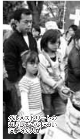
クルメストリートのおいしそらなにおいて多くの人が