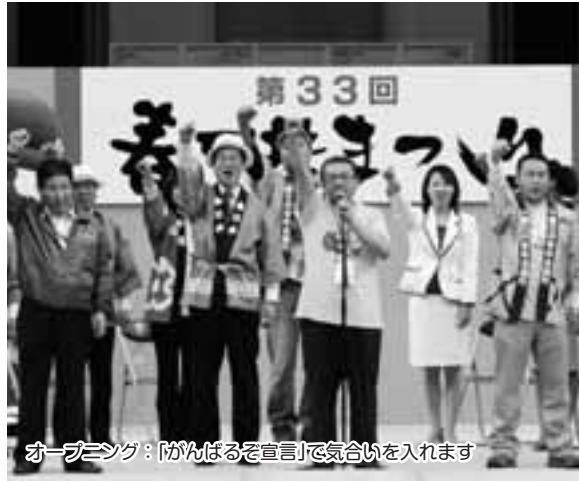
オープニング：「がんばるを宣言」で気合いを入れます