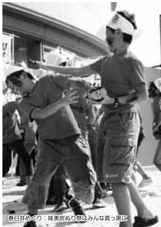
春日井めぐり：味美炭めり祭はみんな真っ黒に