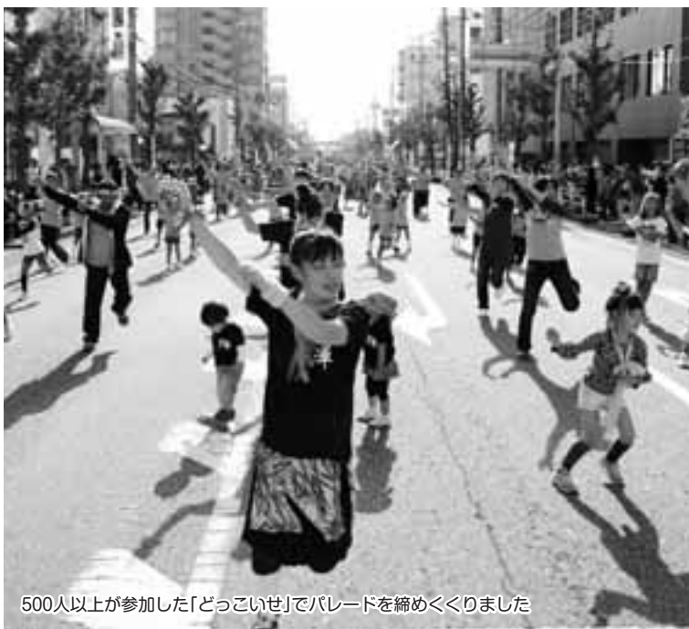
500人以上が参加した「どっこいせ」でパレードを締めくくりました