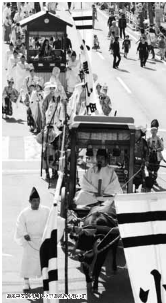
道風平安朝行列：小野道風と小野小町