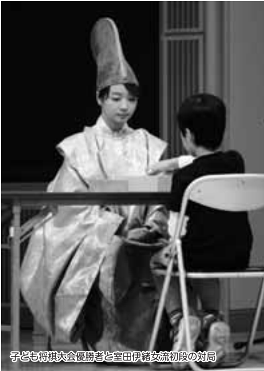
子ども将棋大会優勝者と室田伊緒女流初段の対局