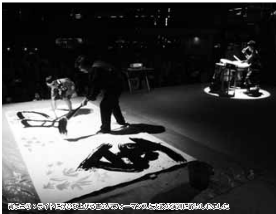
宵まつり：ライトに浮かび上がる書のパフォーマンスと太鼓の演奏に酔いしれました