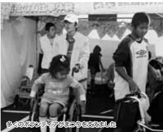
多くのボランティアがまつりを支えました