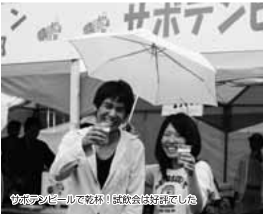
サポテンビルで乾杯！試飲会は好評でした