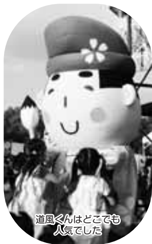
道風くんはどこでも人気でした