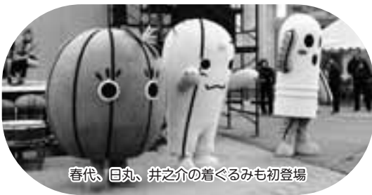
春代、目丸、井之介の着ぐるみも初登場