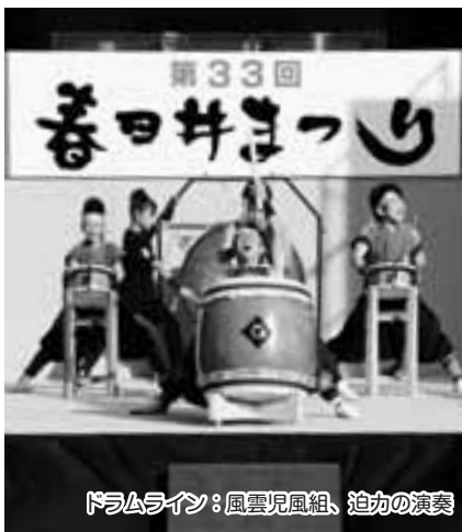
ドラムライン：風雲児風組、迫力の演奏