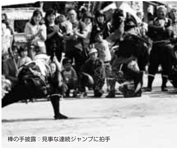
棒の手披露：見事な連続ジャンプに拍手