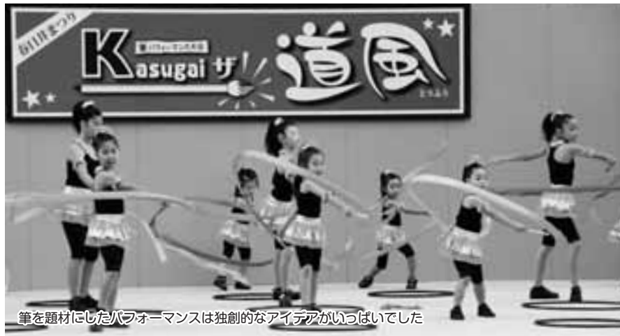
筆を題材にしたパフォーマンスは独創的なアイデアがいっぱいでした