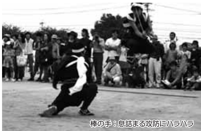
棒の手：息詰まる攻防にハラハラ