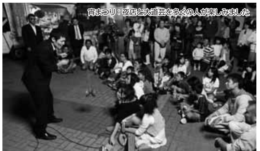
宵まつり：夜店と大道芸を多くの人が楽しみました