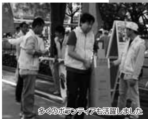
多くのボランティアも活躍しました