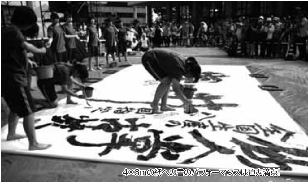
4×6mの紙への書のパフォーマンスは迫力満点!