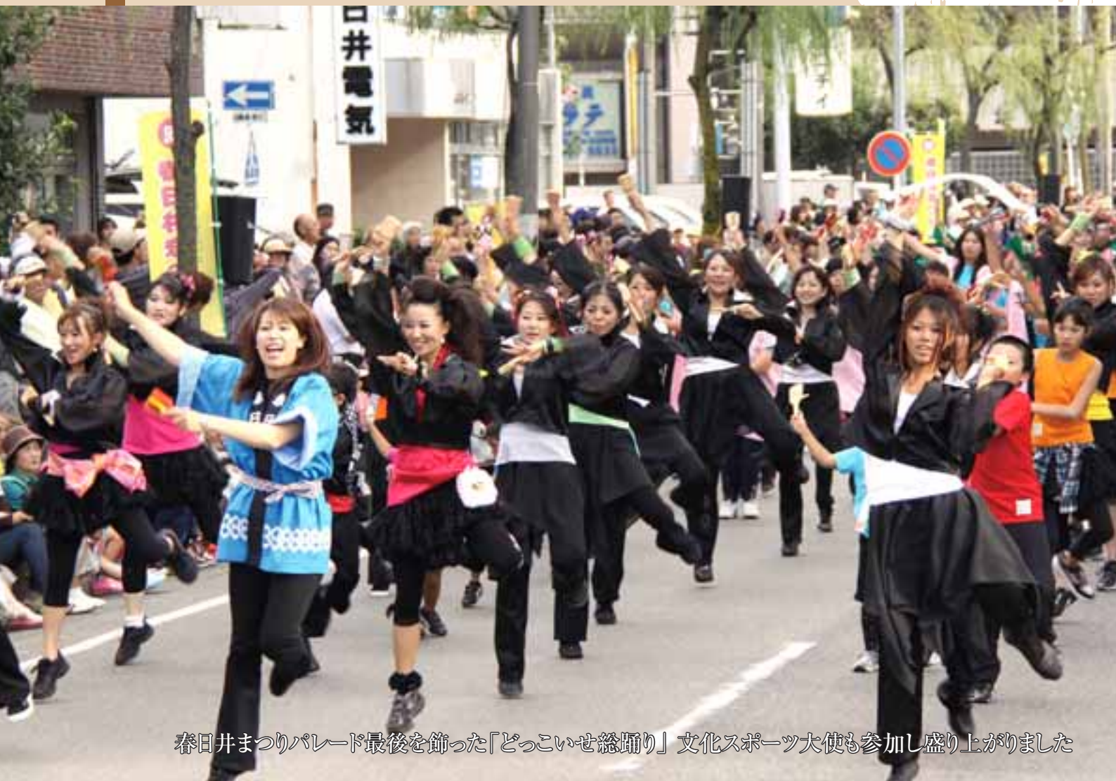
春日井まつりパレード最後を飾った「どっこいせ総踊り」文化スポーツ大使も参加し盛り上がりました