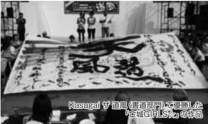
Kasugai ザ 道風(書道部門)で優勝した『金城GIRLS☆』の作品