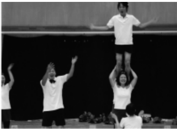
最優秀賞「チアーズ!!」