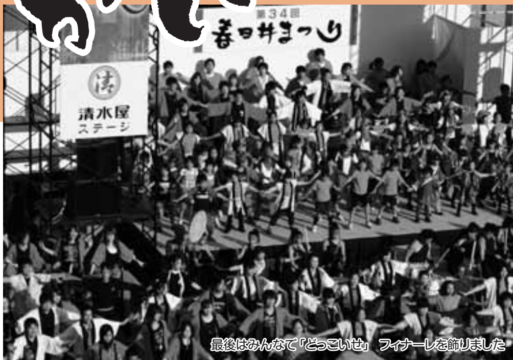
最後はみんなで「どっこいせ」フィナーレを飾りました