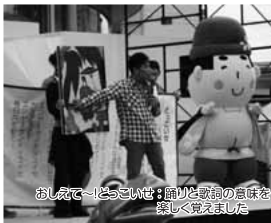
おしえて〜!どっこいせ：踊りと歌詞の意味を楽しく覚えました