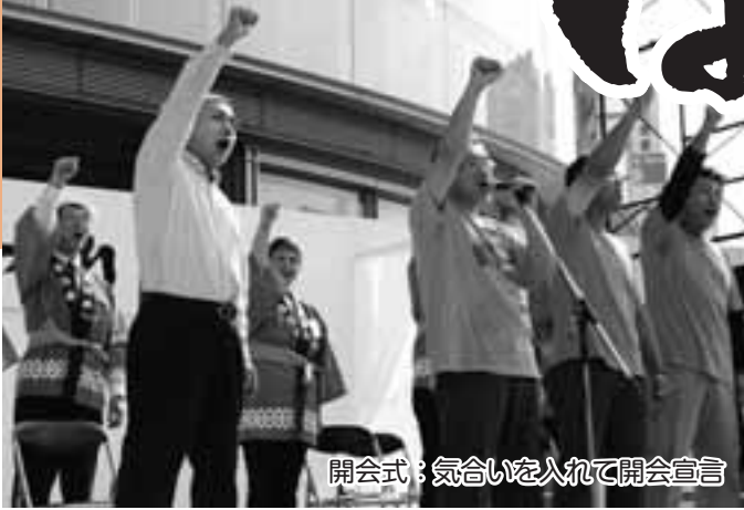
開会式：気合いを入れて開会宣言

10月16(土)~17日(日)に行われた春日井まつりは晴天に恵まれ、2日間で20万人以上の方が訪れました。今年のハイライトを写真で紹介します。