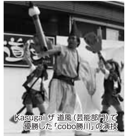
Kasugai ザ 道風(芸能部門)で優勝した「cobo勝川」の演技