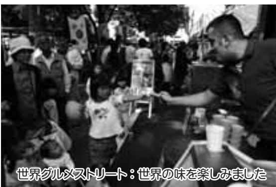
世界グルメストリート：世界の味を楽しみました