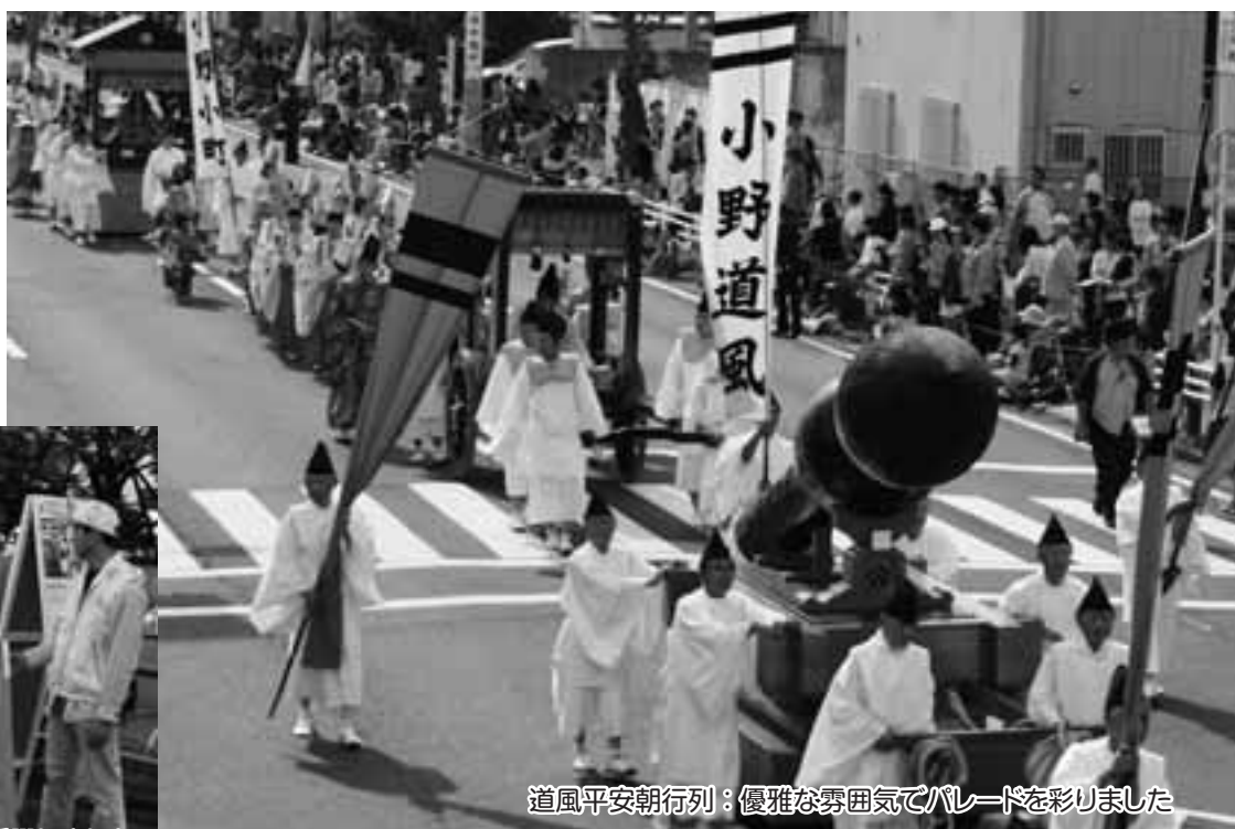
道風平安朝行列：優雅な雰囲気で行進を彩りました