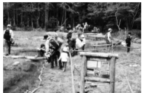
ビオトープでの自然観察会の様子