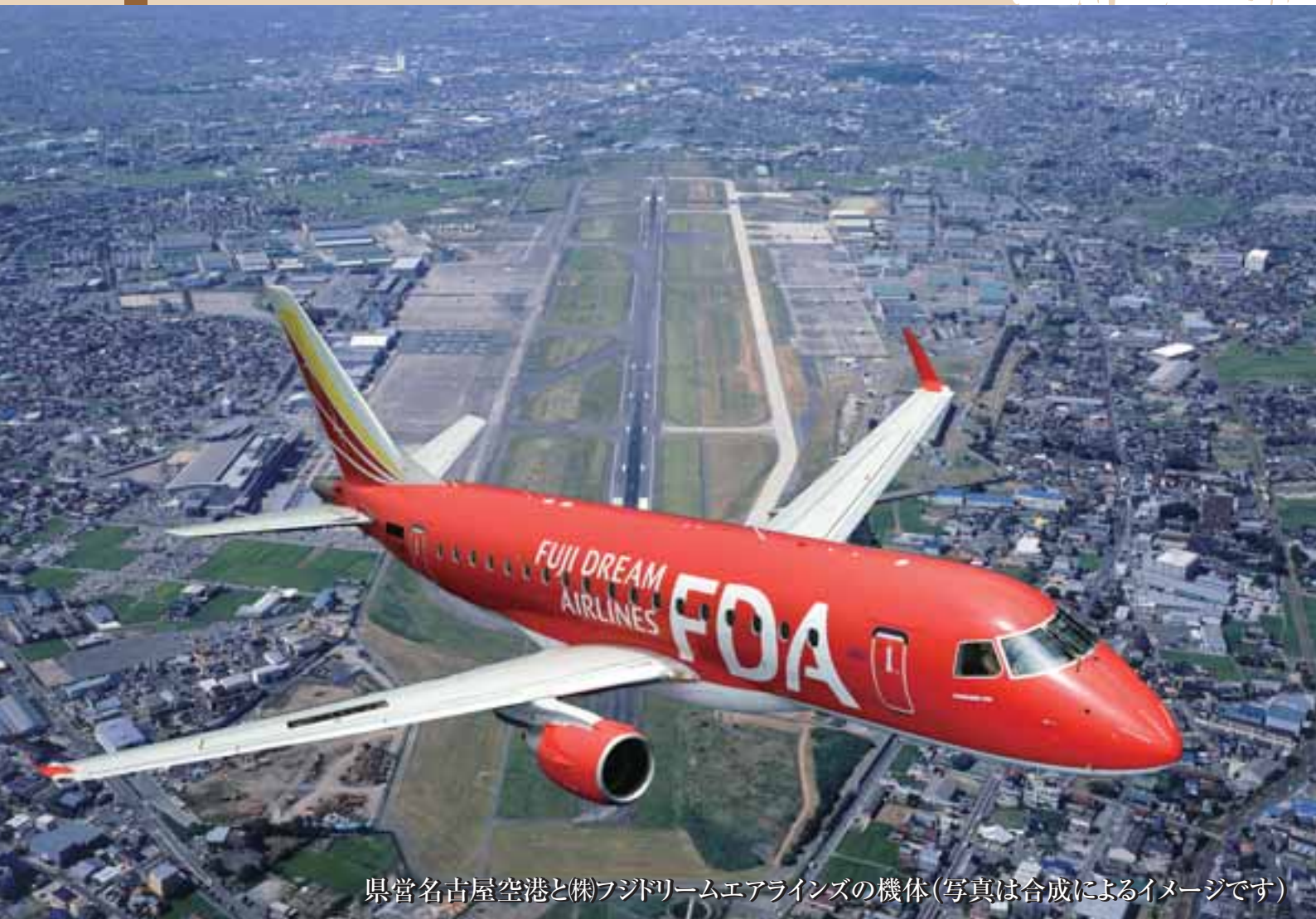
県営名古屋空港と株フジドリームエアラインズの機体(写真は合成によるイメージです)