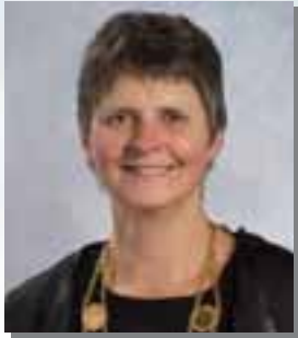
シャロン・シェパード市長

10月中旬に姉妹都市のカナダ・ケローナ市から、シャロン・シェパード市長を始めとした38人が訪問します。訪問団は、春日井まつりに参加し、姉妹都市として各分野のPRを行う予定です。