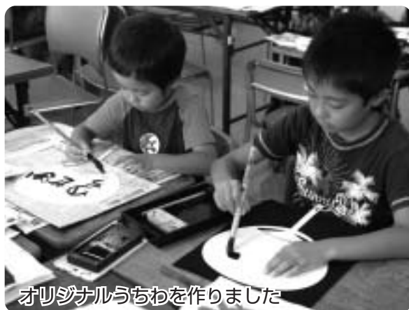
オリジナルうちわを作りました