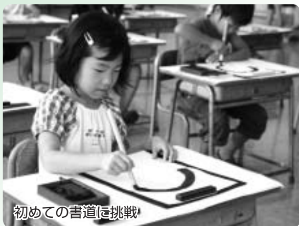
初めての書道に挑戦