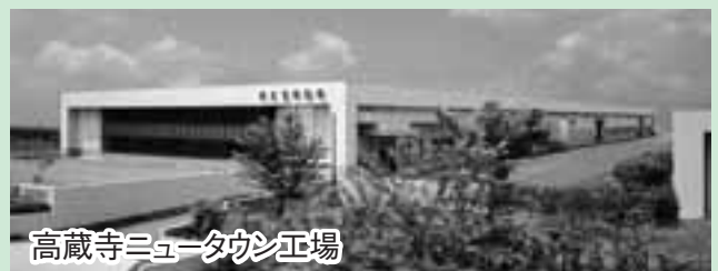
高蔵寺ニュータウン工場

昭和28年創業。「見えすぎちゃって困る!」のキャッチコピーで有名なマスプロ電工(株)は、テレビ文化の発展とともに歩んできました。平成23年7月の地上デジタル放送完全移行に向け、「地デジを全ての人に届けたい」をスローガンに、デジタル放送の普及促進、放送インフラ整備など、デジタル化の推進に貢献しています。