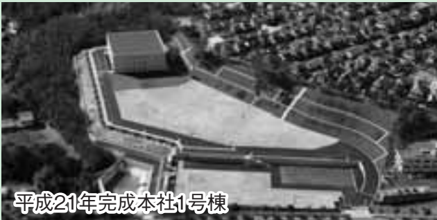
平成21年完成本社1号棟

昭和56年創業。半導体業界や医療機業界で使用される「バルブ」を製造・販売しています。半導体業界の役割の1つは、「ナノ」の世界を可能にする製品の開発です。業界でのオピニオンリーダーを目指し、日々励んでいます。